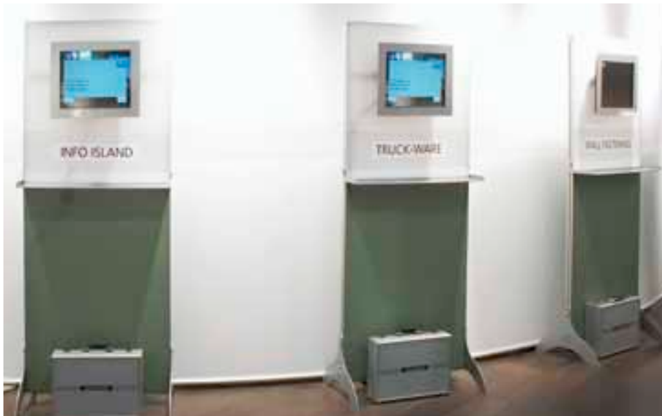
INFO-ISLAND zweiseitig / INFO-ISLAND double-sided, 800 x 2000