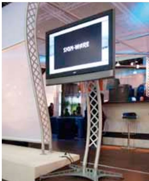
INFO-ISLAND für 42-Zoll Monitor / for 42 Inch screen